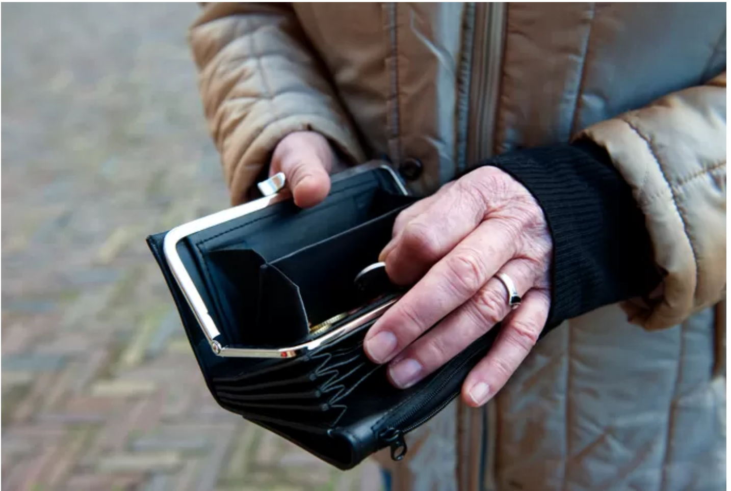
De pensioenuitkeringen dreigen volgend jaar verlaagd te worden.

Pijnlijk is het zeker, dreigende kortingen op de pensioenen. Het nieuwe pensioenstelsel wordt juist aangeprezen met het argument dat de pensioenen sneller kunnen worden verhoogd. Als gepensioneerden en deelnemers de komende jaren met onnodige kortingen te maken krijgen zal het wantrouwen alleen maar toenemen, vrezen de pensioenbestuurders.