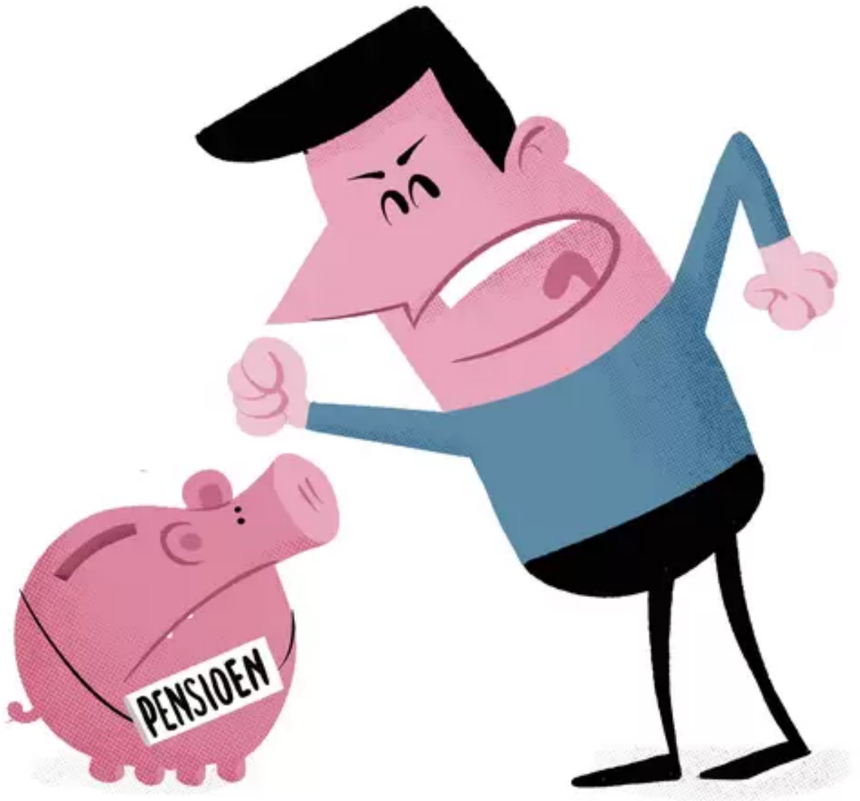
Illustratie. © Nozzman

In het nieuwe stelsel mogen de pensioenen wel verhoogd worden als de rendementen goed zijn. ABP en PMT willen dat in de periode tot 2026 vast met die regels gewerkt wordt. „Dan weten we zeker dat we geen onnodige kortingen hoeven door te voeren”, zegt Troost. „Maar kortingen zijn niet uitgesloten. We kunnen de pensioenen verhogen als het goed gaat, maar moeten ze ook korten als het minder gaat. Per saldo zal het echter beter uitpakken voor onze deelnemers verwachten wij.”